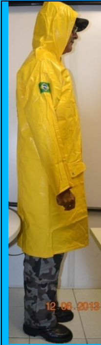
Na Manga Direita em Bordado a Bandeira do Brasil